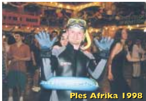
Ples Afrika 1998