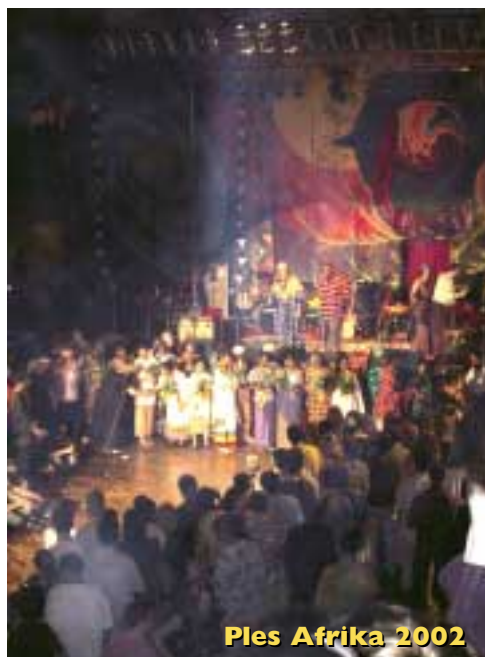
Ples Afrika 2002