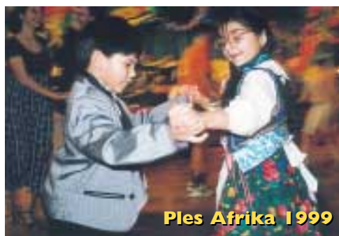
Ples Afrika 1999