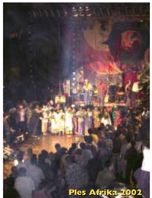
Ples Afrika 2002