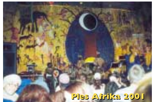
Ples Afrika 2001

2002 - PLES AFRIKA pro velký úspěch byl opět ve stylu afrolatinských rytmů, zaměřen na kulturu Afriky. Oficiálně zde byl zahájen projekt "Adopce afrických dětí" - projekt pomoci na dálku, proběhla sbírka školních potřeb a výtěžek byl věnován na projekty KLP v Africe. Hrál ŠUM SVISTU , Létající koberec, Hermakuti, Orchestr J. Hlavsy, Back to culture. BYLA OPĚT ÚPLNĚ VYPRODANÁ LUCERNA!