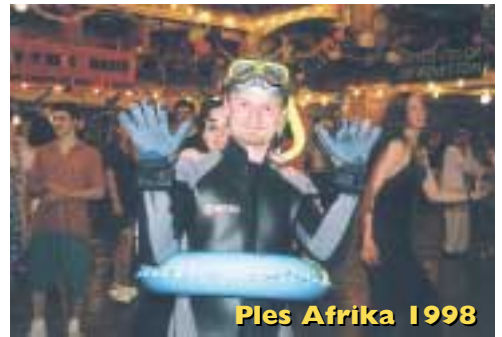
Ples Afrika 1998

1998 - PLÁŽOVÝ PLES VE STYLU STŘEDOMOŘÍ proběhl pod záštitou ministra školství, mládeže a tělovýchovy ČR Jana Sokola. Byl zaměřen na kulturu řeckou, španělskou a izraelskou. (1658 platících návštěvníků, 268 organizátorů)