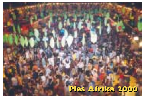
Ples Afrika 2000

2001 - PLES AFRIKA proběhl opět pod záštitou Úřadu vysokého komisaře OSN pro uprchlíky. Byl ve stylu afrolatinských rytmů, zaměřen na kulturu Afriky. Nechyběla vystoupení etnických hudebních i tanečních skupin, výstava fotografií, módní přehlídka, sbírka pro projekty Kampaně lidské podpory, bohatá tombola ani informační stánky organizací jako Amnesty International. Výtěžek byl věnován na projekty Kampaně lidské podpory v africké Guineji a Keni.