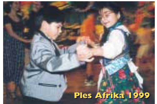
Ples Afrika 1999

1999 - PLÁŽOVÝ PLES VE STYLU ČERNÉHO MOŘE proběhl pod záštitou ministerstva školství, mládeže a tělovýchovy ČR. Byl zaměřen především na kulturu romskou a židovskou. (1530 platících návštěvníků, 354 organizátorů)