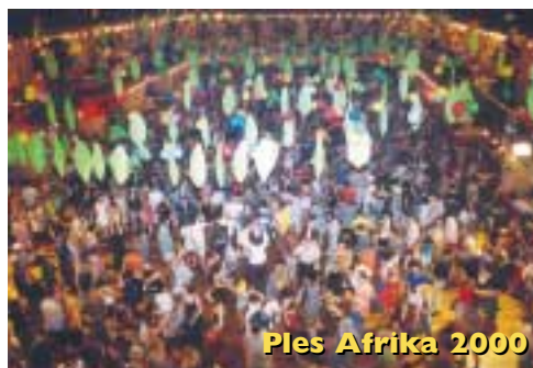
Ples Afrika 2000