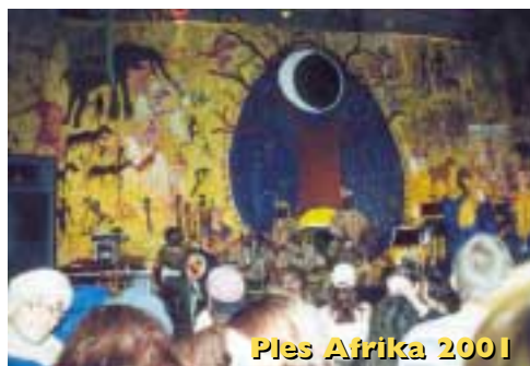
Ples Afrika 2001