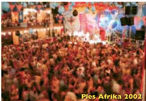
Ples Afrika 2002

na projekty KLP v Africe. Hrál YOYO BAND , Létařící koberec, TiDiTaDe, Orchestr J. Hlavsy, Tam Tam orchestra. BYLA OPĚT VYPRODANÁ LUCERNA!