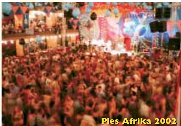
Ples Afrika 2002