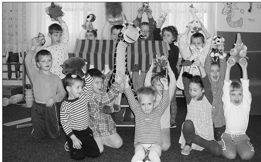
Děti z mateřské školy Krumvír si na pomoc při malování přizvaly i svoje plyšové kamarády.