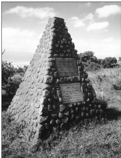
Pomník – M. Grzimek a prof. B. Grzimek, Ngorongoro (Tanzánie)